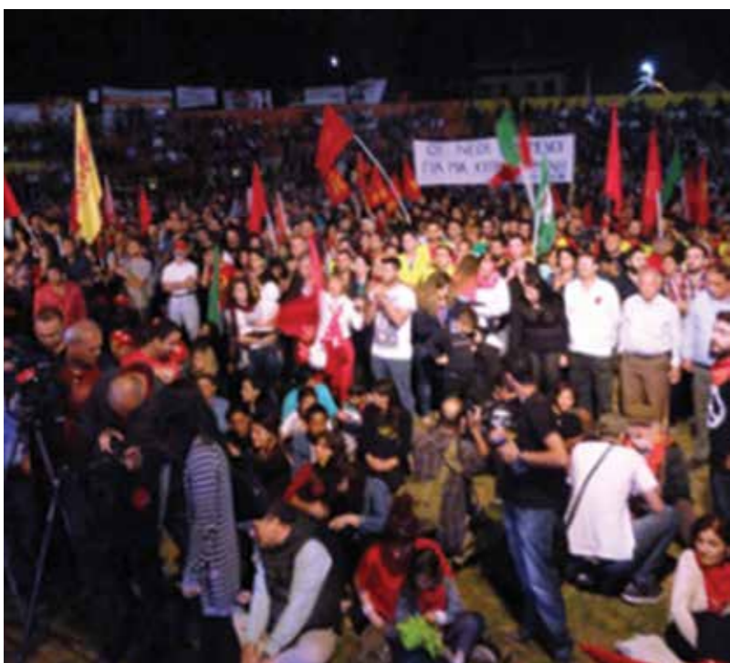
Δικαιοτική Εκδήλωση Πρωτομαγιάς, γήπεδο Τσετίγκαγια, 2014